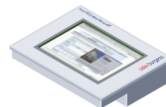
Saia® PCD Web-Panel eXP PCD7.D6150TM010